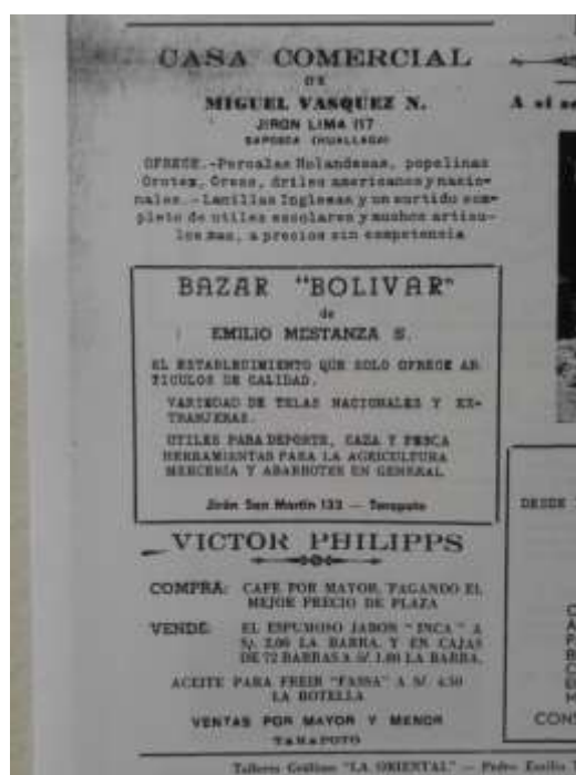
Figura 5 - Anúncios publicitários nas páginas do periódico El Sol, Tarapoto, 1959

muito incipientes, sendo que não existiam profissionais da área para produção de anúncios, muito menos agências estruturadas para tal atendimento. Os principais anunciantes dos primeiros anos do periódico podem ser vistos na Figura 5, abaixo.