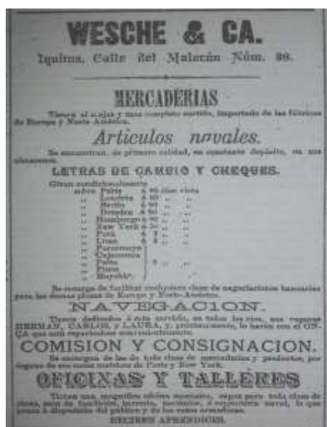
Figura 3 - Anúncios publicados no jornal “El Independiente”, 1895

Já se nota, por esta época, que as peças publicitárias ganhavam espaços importantes em cada edição (Figura 3), ocupando páginas inteiras com anúncios de vários segmentos. Dentre estes, a ênfase era nas casas de vendas de produtos vindos da Europa, representações de casas europeias que compravam produtos extraídos dos “Shiringales” loretanos. Outros destacados eram os anúncios de chegadas e partidas das lanchas que faziam o transporte de cargas e passageiros entre as cidades amazônicas e a capital, Lima, bem como a realização das rotas entre Iquitos e Manaus e Belém, no Brasil, além de anúncios de hotéis.