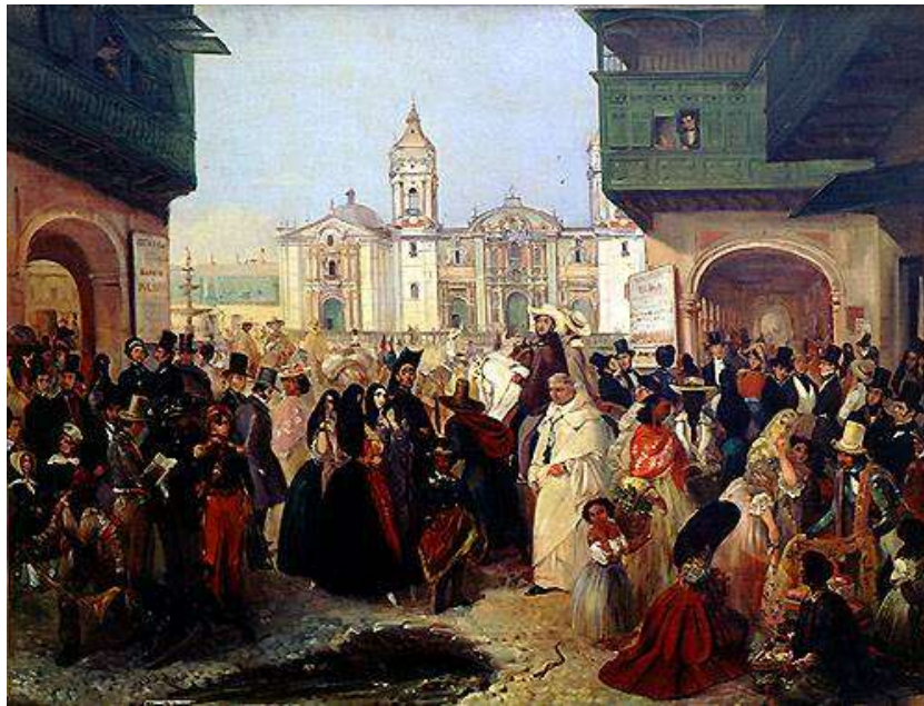
Figura 2 - Pintura de Rugendas: “La Catedral y Plaza Mayor de Armas”, 1843