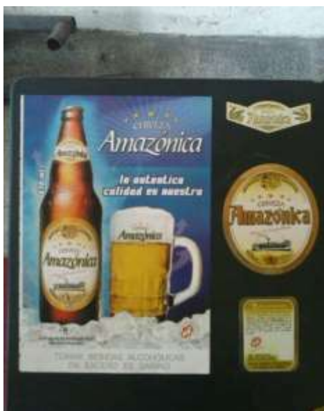
Figura 4 -Trabalhos de Tabano Publicidad

Passados alguns anos, em 2000, é fundada a Tabano Publicidad, por Guillermo Abadie Saens, 34 anos, fotógrafo e Rolando Riba Rios, 40 anos, publicitário com especialização em desenho gráfico, sendo o primeiro profissional com graduação superior em publicidade a atuar na cidade de Iquitos. A empresa funciona até os dias de hoje, sendo que apesar da distância do grande centro econômico do Peru – Lima – eles conseguem manter uma regularidade em suas atividades, atendendo clientes locais e também de outros países, com a produção de material publicitário (Figura 4).