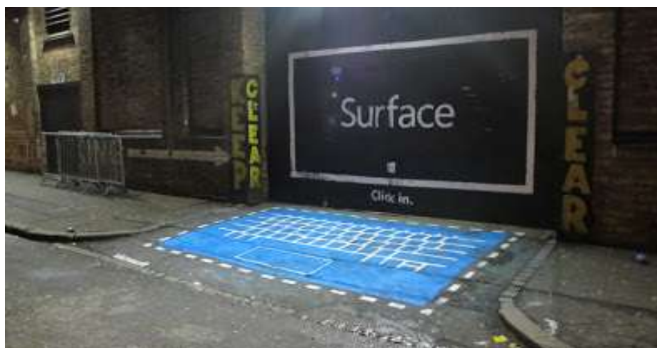
Figura 1 - Anúncio da CURB para lançamento de produto da Microsoft, em uma rua na cidade de Londres

Para ilustrar a importância das empresas da atividade publicitária em contribuir com as mudanças de consumo e estímulo de outros modos de consumir, algumas agências de publicidade já têm demonstrado que é possível mudar seus próprios hábitos de produção publicitária, sem deixar de ser rentável. Um exemplo disso é o da agência inglesa CURB 278 que desenvolve seus trabalhos publicitários utilizando somente materiais que tenham como princípio o mínimo de impacto negativo ao meio ambiente e que está surpreendendo pela forma inovadora como ela se propõe a fazer mídia. Nesses termos, a Curb utiliza recursos criativos para dar visibilidade ao cliente, como desenhar marcas limpando as calçadas com água, podando plantas, esculpindo areia ou marcando árvores com a luz do sol.